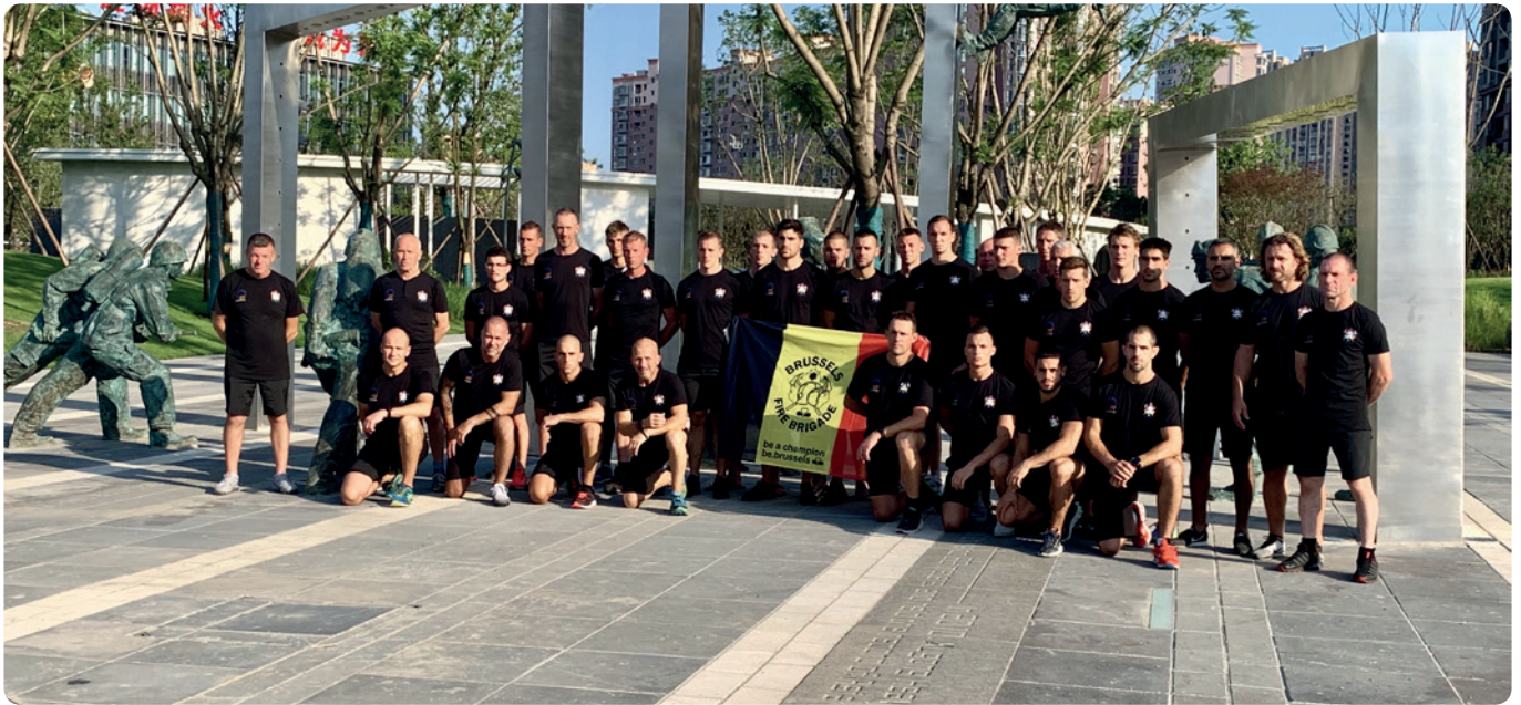
De Brusselse brandweer in China.

De Brusselse brandweer is goed voor 350 à 400 interventies per 24 uur voor de 19 Brusselse gemeenten. Elke dag opnieuw staan deze mannen en vrouwen paraat. Ze komen tussen bij branden, verkeersongevallen maar ook voor wateroverlast, dieren in nood... Een goede conditie is dan ook een must. Sommigen blinken uit in een aantal sporten. Bewijs daarvan is het binnenvallen van 44 medailles op de World Police and Fire Games in Chengdu, China.