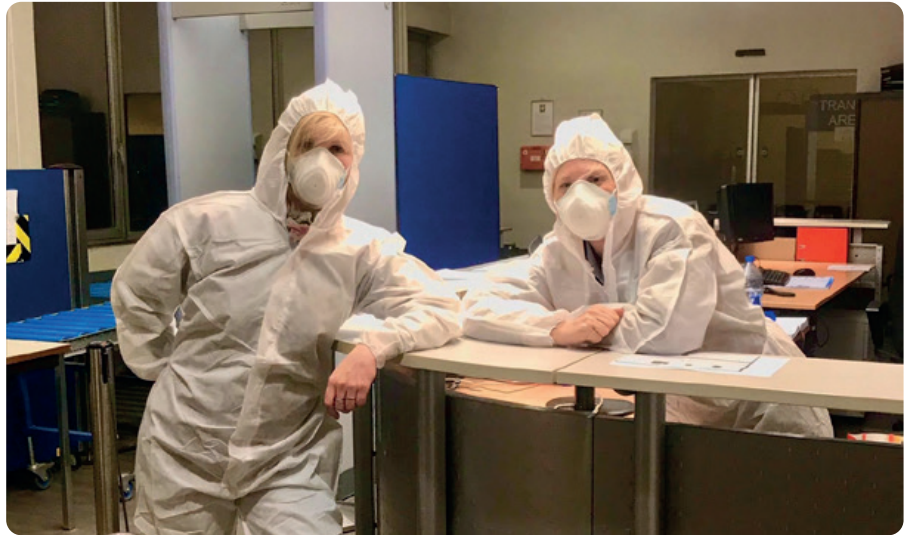
Klaar voor de strijd.

and rescue in Koksijde is het business as usual. Onder het motto 'Aude audenda' staan zij de klok rond paraat om met hun NH90-helikopter uit te rukken en mensen te redden te land, ter zee en zelfs in de lucht. De ploegen van DOVO blijven uitrijden wanneer nodig, ook nu we zoveel mogelijk binnen blijven. Mits de nodige voorzorgen gaan de noodzakelijke interventies door. Voor de militairen op missie loopt het werkregime gewoon door. Die vrouwen en mannen staan in voor opdrachten op eigen bodem (Operation Vigilant Guardian - OVG) en bereiden zich voor of nemen deel aan de lopende buitenlandse operaties. Ook al bemoeilijken bepaalde opgelegde inperkingsmaatregelen de rotatie van de detachementen