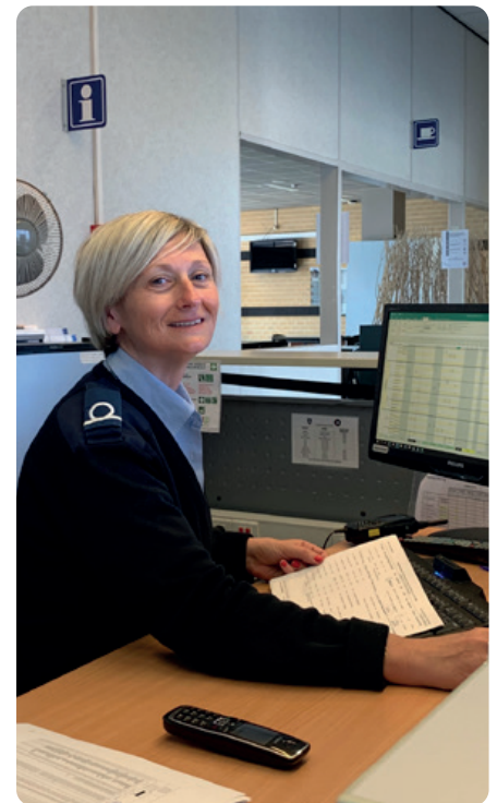
Adjutant Eléonore De Astis: “Tijdens deze crisis is de rol van het leger niet te onderschatten.”

“De maatregelen hadden veel strenger moeten zijn van bij het begin, dan hadden we de crisis sneller onder controle gekregen. Jammer genoeg is het beleid in Europa in elk land verschillend.”