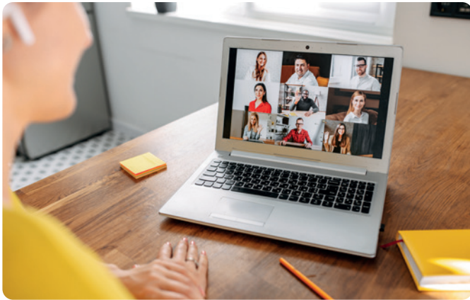
Om de anonimiteit van de kandidaten, de jury en het respect voor het beroepsgeheim te garanderen, zijn de beelden fictief nagebootst.

T ijdens de coronacrisis blijft Justitie functioneren en gaat op zoek naar nieuwe contractuele ambtenaren. We werden recent uitgenodigd voor een volledig gedigitaliseerde selectie. Dit betekent dat de 3 kandidaten, de voorzitter van de jury, de twee assessoren en, in voorkomend geval, de vakbondsdelegaties alleen d.m.v. videoconferentie aanwezig zouden zijn. Voor ons zet dit type selectie niet iedereen op gelijke voet. We hebben drie grote problemen geïdentificeerd die we niet kunnen accepteren. Ten eerste vergroot het de digitale kloof tussen mensen, ten tweede de mogelijks ongelijke behandeling van de kandidaten en ten slotte het eventueel schenden van het beroepsgeheim.